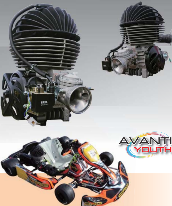
試乗車両：CRG KT2 / AVANTI 19 / YH SL07

試乗会についてのお問い合わせ、詳しい内容につきましては、最寄りのカートショップ様またはCRG JAPAN名古屋支店(052-506-8522)までお問い合わせください。